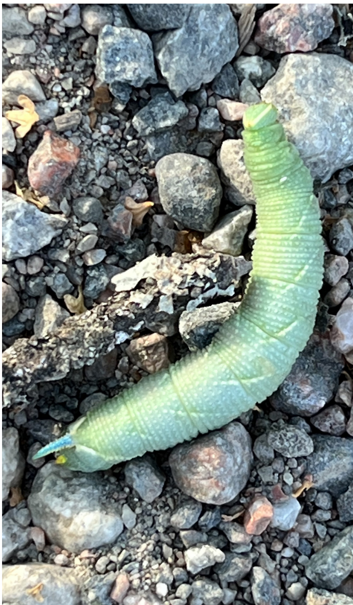
Larv av Mimas tiliae (Lindsvärmare)