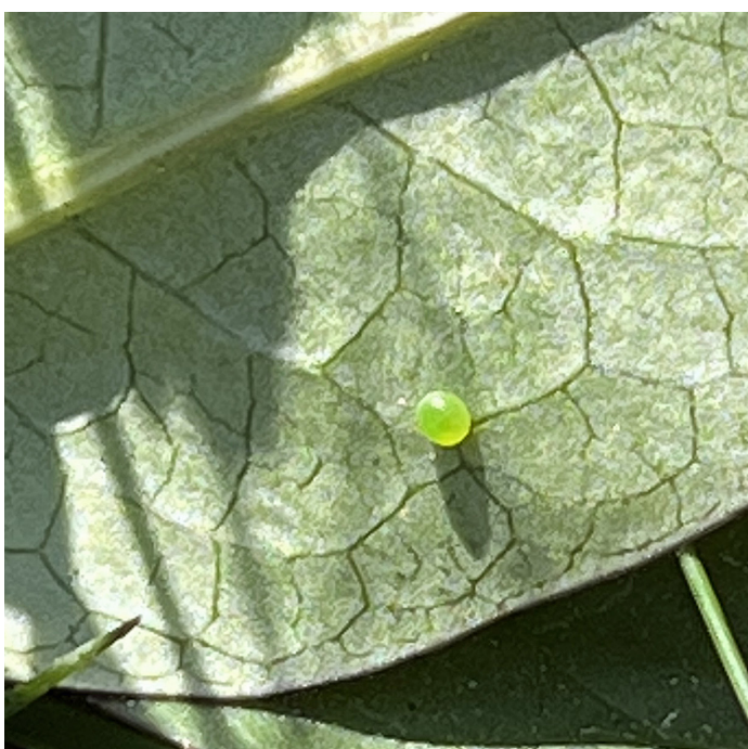
Ägg av Hemaris tityus (Svävflugedagsvärmare)

2206 - Hyles galii : 1 larv noterades 29/7 vid St.Fjädersvall, Tullgarn dessutom 1 ex 29/7, 1 ex 1 - 5/8 , 1 ex 10/8 Trosa samt 1 larv som hittades den 10/9 på en