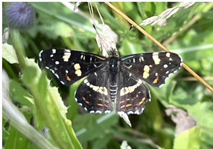
Araschnia levana (Kartfjäril)

De nya storfjärilsarter för Trosa/Mörkö-området som noterades 2022 är: