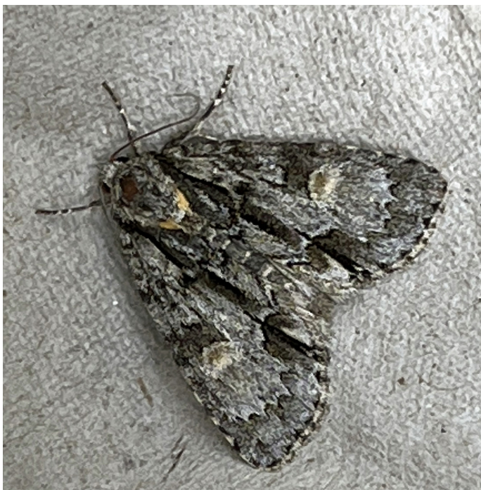
Acronicta strigosa (Streckaftonfly)

2317 - Catocala nupta : 1 ex 15 - 29/8, 1 ex 30/8 - 9/9