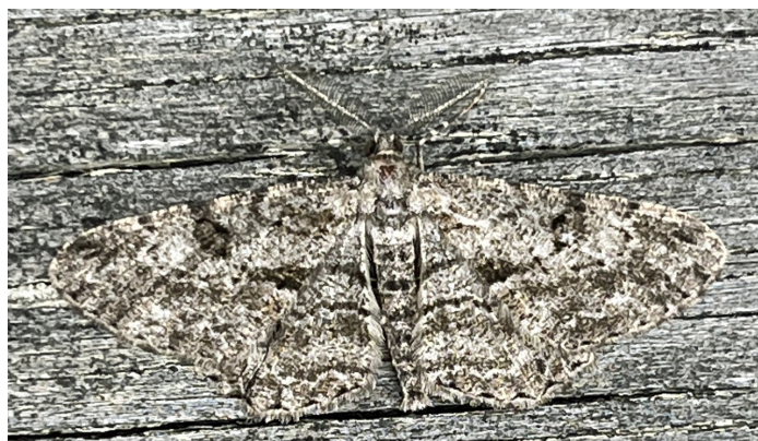
Peribatodes rhomboidaria (Frukträdlavmätare)