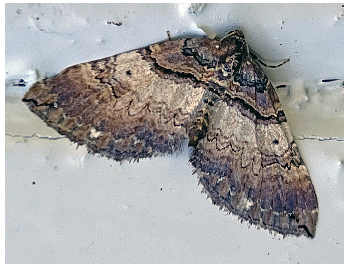
Earophila badiata (Brungul fältmätare)

2198 - Mimas tiliae : 1 ex en larv hittas död 14/8 Ogen-