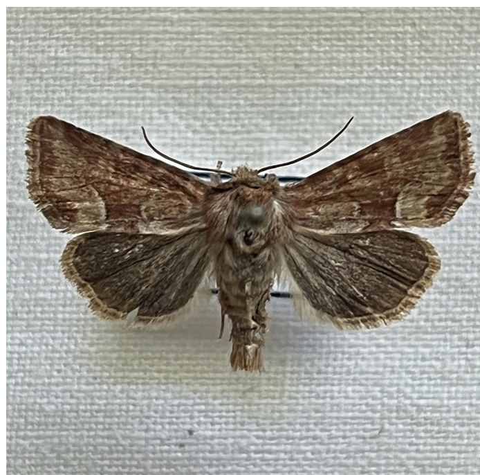
Oligia fasciunculus (Rödgult ängsfly)