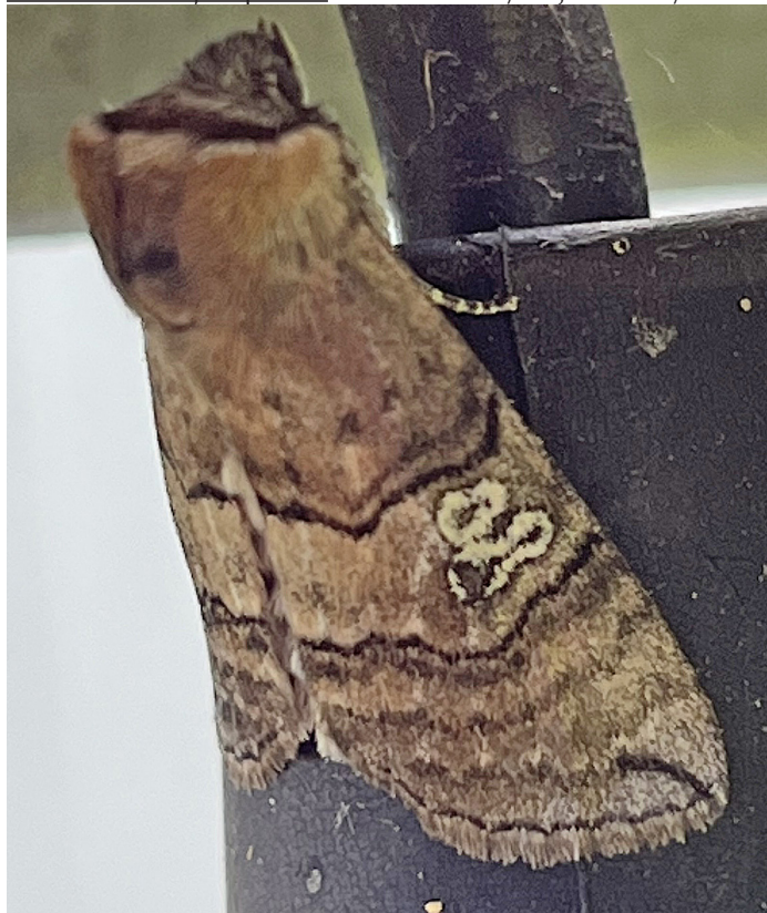
Tethea ocularis (Rödaktig blekmaskspinnare)

1963 - Thera juniperata : 1 ex 16 - 23/10, 1 ex 24/10