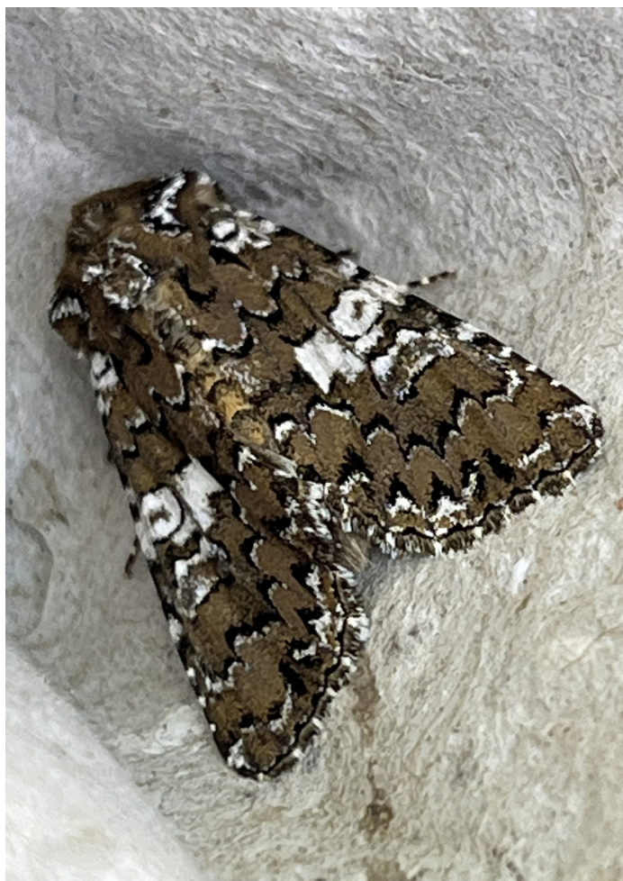
Hadena albimacula (Vitfläckat nejlikfly)