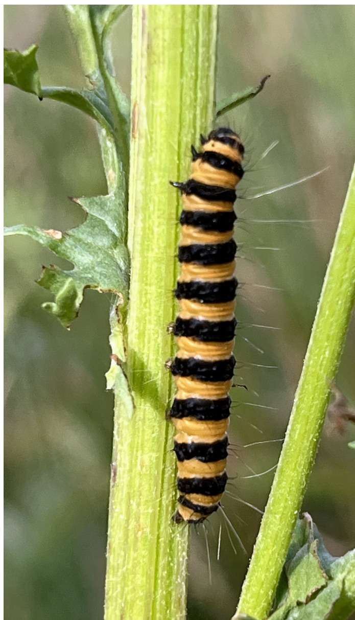
Larv av Tyria jacobaeae (Karminspinnare)

2438 - Oligia fasciunculus : 1 ex 28/6 - 1/7 Trosa. Ny art för området (LJRS).