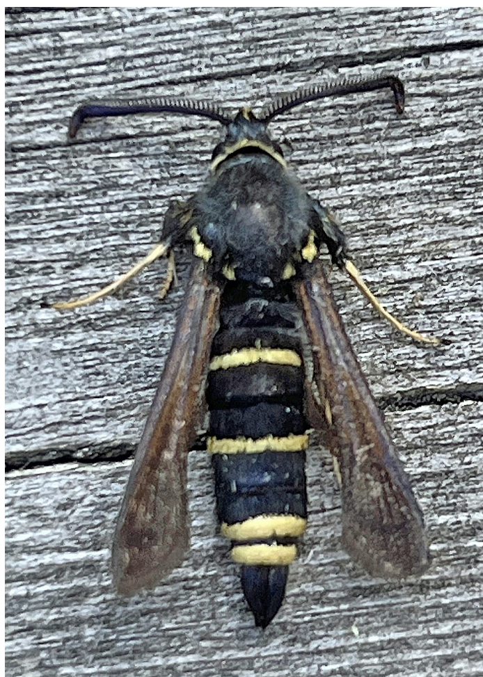
Paeanthrene tabaniformis (Svart poppelglasvinge)

1676 - Microstega hyalinalis : 1 ex 13/7 St.Uttersvik