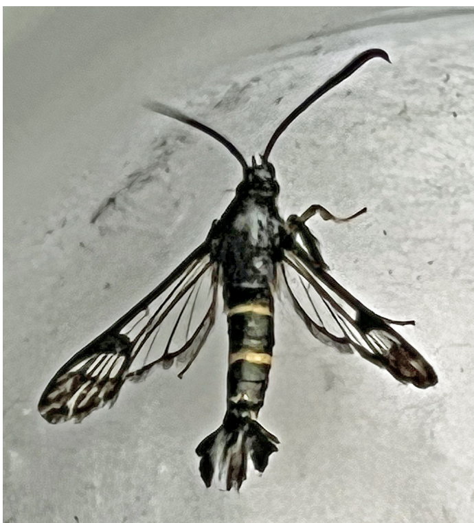
Synanthedon flaviventris (Krypvideglasvinge)

1812 - Lycaena virgaureae : 1 ex 13/7 St. Uttervik. Ny lokal, kul att se arten igen då den är ovanlig och minskande i antal inom området (LJRS).