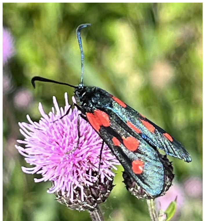
Zygaena lonicerae (Bredbrämäd bastardsvärmare)