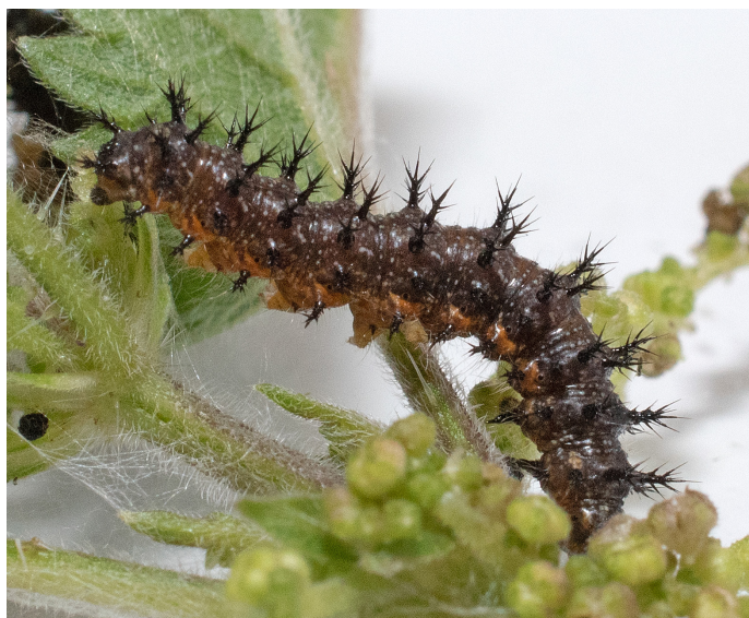
Sensommargenerationen av kartfjäril i Sörmland. Fotograferade 24/7 resp. 31/8 2022.