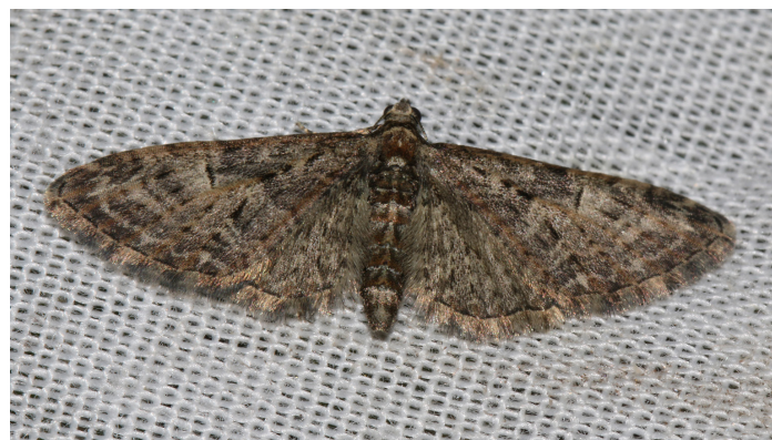
Eupithecia abbreviata , större ekmalmätare.

Pilgördelmätare Cyklophora pendularia flera ex i juni (JS,KA) Linudden Nyköping, oftast enstaka.