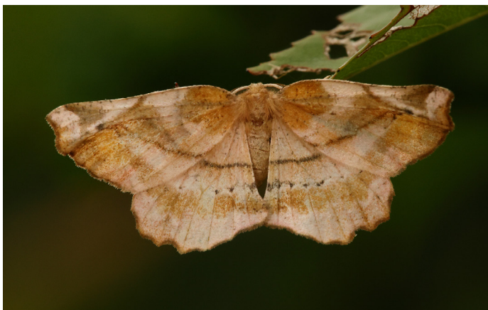
Apeira syringaria, syrenmätare.

I år hade många arter fler generationer än normalt. I vissa fall i stora antal. Nedan följer ett axplock av sådana fynd. Framtiden får utvisa om dessa fenomen påverkar populationerna i någon riktning.