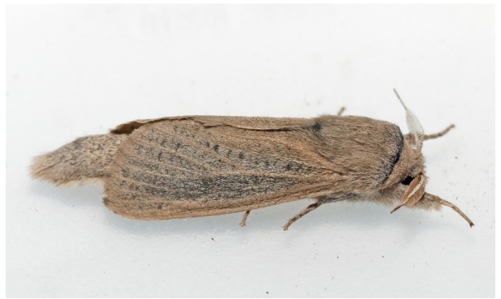
Phragmataecia castaneae , vassborrare.

Kungslavspinnare Lithosia qadra Många lokaler i flyg- tid bla. 1 ex 30/7 Buskhyttan (JS).