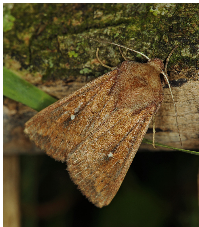
Mythimna albipuncta, vitpunktsgräsfly.

Blågrått kapuschongfly Cucullia lactucae > 10 ex flera olika lokaler juni-augusti. På uppgång.