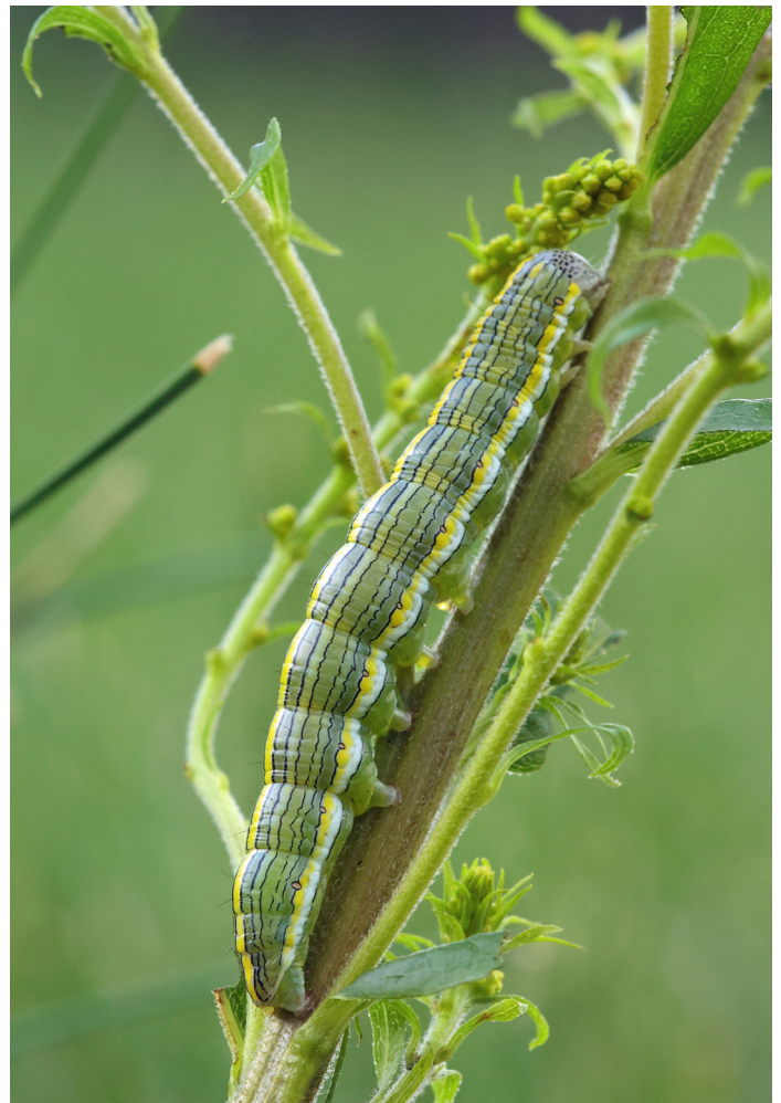
Cucullia asteris , asterkapuschongfly.

Vinkeljordfly Opigena polygona 1 ex 8/9 Höglunda Ludgo (ASK) Ganska vanlig vid Rysstoppen i september m.fl. kustlokaler.