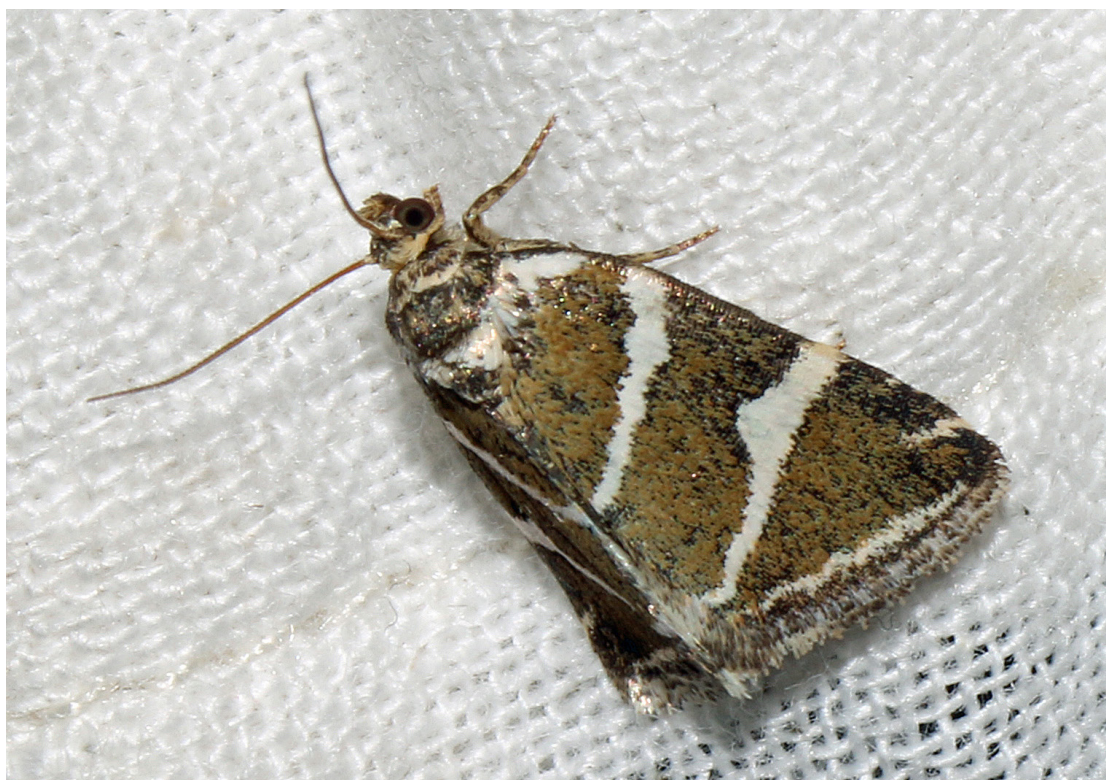
Deltote bankiana, tvärestreckat glansfly.