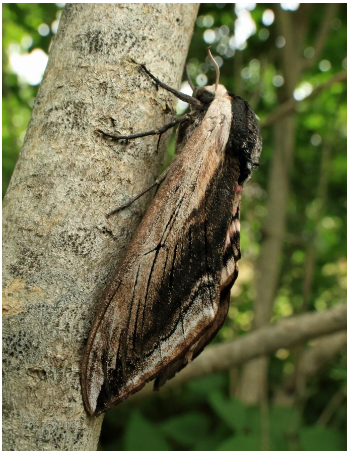
Sphinx ligustri , ligustersvärmare.

Silkessäckspinnare Phalacropterix grasinella Flera säck- ar i juni vid Bötet, 2020 och 2021 (KA).