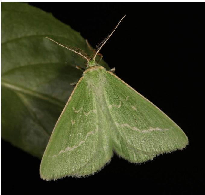
Thetidia smaragdaria , midsommarmätare.

Alaftonfly Acrionicta alni 1 ex juni (JS,KA) Linudden.