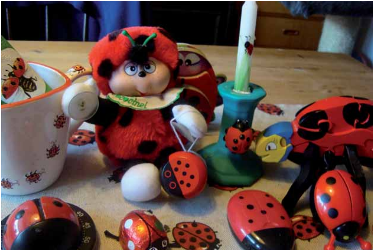
Fig.2 Nyckelpigedesignade föremål

Familjen nyckelpigor bildar tillsammans med ett 80-tal andra familjer såsom Fam. Svampbaggar (Fam.Endo-