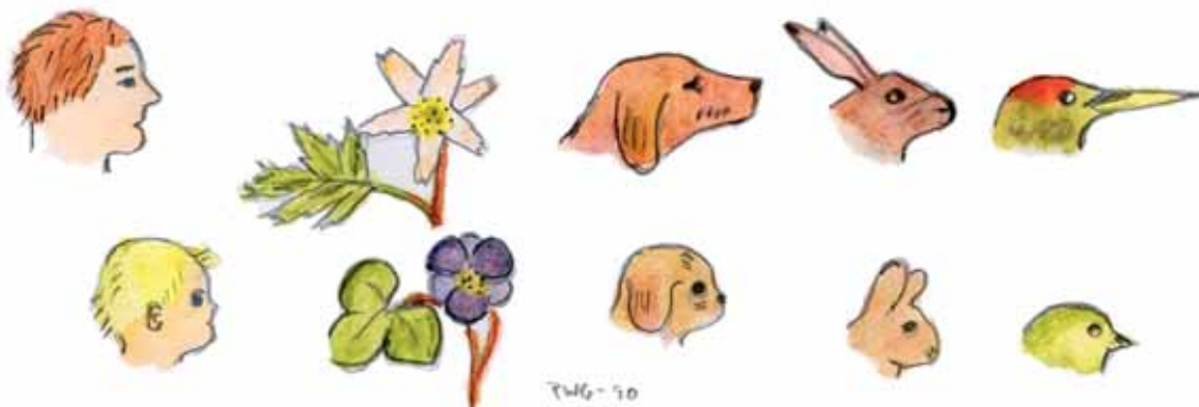
Fig.1 Runda och vassa former. Vilka är gulligast?

inte bara den välvilliga inställningen till nyckelpigor som gör nyckelpigenamnet kommersiellt lämpligt, även själva bilden av en nyckelpigelogga är svår att missa. Nyckelpigans skarpa s.k. aposomatiska färger (*1) fungerar ungefär som en stoppskylt i trafiken, färgkombinationen ger en tydlig signal som kräver uppmärksamhet. Ett stort företag som använder nyckelpigeloggor är det engelska manufaktur företaget Woolworths, som f.ö. var först med T-shirten och som nu mest säljer barnkläder. Det presenterar sig numera som the Ladybird Company. Om företaget i stället skulle marknadsföra sig med bilder från när det låg i det nazistockuperade Sudettyskland (*2) med hakkors på