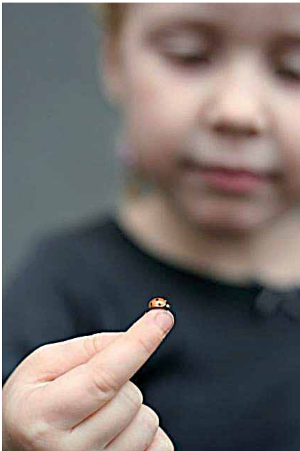
Fig.4 Barn med nyckelpiga på pekfingeret

Maria Nyckelpiga! Flyg öster, flyg väster, Flyg norr, flyg söder Flyg hem till dina ungar och giv dem mat och kläder