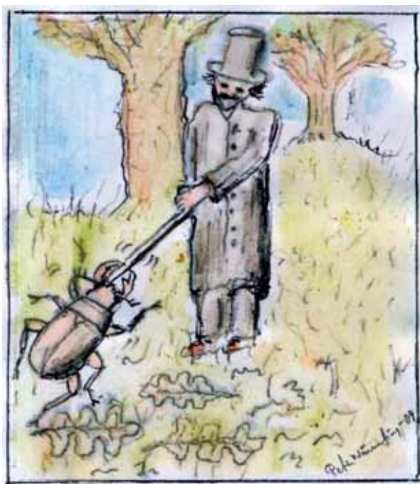
Fig.3. Strindberg och ekoxen

insekterna ansåg han nyckelpigan vara, för den flydde helt enkelt iväg från människan så fort den kunde!