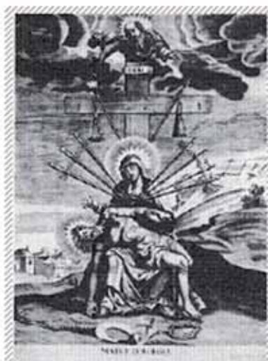
Fig 4. "Vår Fru av de sju smärtorna" Målad av Philipp Steuder (1700-talet). Pietà-motiv. Ur N.Rapps samlingar. Stockholm.

Gulmåran ansågs i Germanien först tillhöra gudinnan Nerthus, Moder-Jord-Gudinnan, men senare Freja. På ett katolskt s.k. koncilium år 734 (Sjögren 1987)